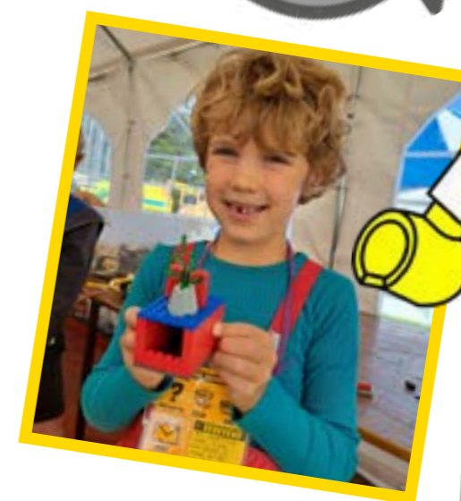
Junte (6 jaar)

"Ik heb een auto gemaakt! Hij wordt nog groter. Dit is wel andere lego dan wat ik normaal gebruik, maar het is heel leuk!"